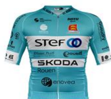
VELOCE CLUB ROUEN 76